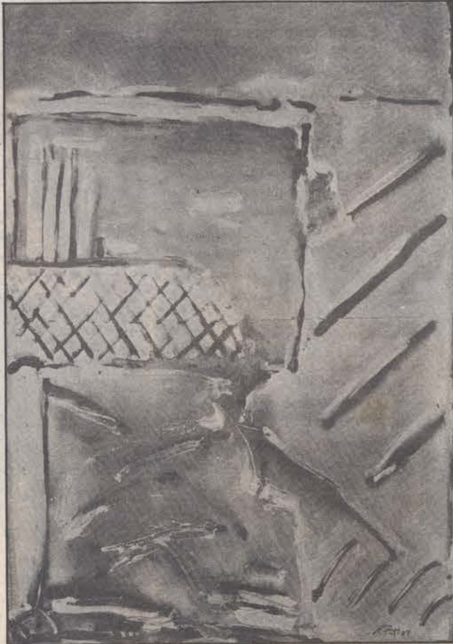
Óleo de Rocha Pinto levado à ARCO/88 pela Galeria Novo Século

A par da melhoria da ARCO em geral, este ano marcada por uma intencionalidade não figurativa e pela presença da mais Nova Escultura, também a representação portuguesa apresentou uma nítida melhoria, com uma selecção mais cuidada e uma melhor montagem dos pavilhões, se bem que a tardia decisão de participar tivesse relegado algumas gale-