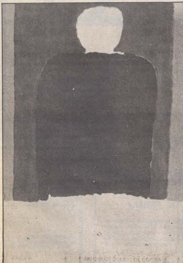
Pintura de Ângelo de Sousa apresentado pela Galeria EMI