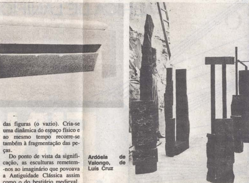
Ardósia de Valongo, de Luís Cruz

As peças funcionam numa escala entre meio metro e dois metros. Jogam com o preenchimento volumétrico do espaço (o cheio da escultura) e o recorte