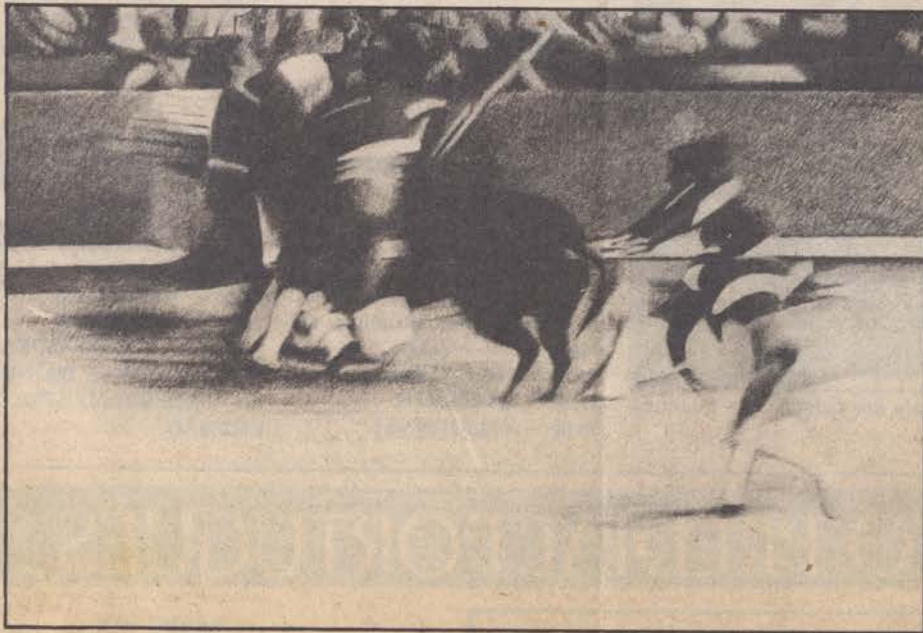
Pintura de José Cândido em exposição na Galeria de Arte do Casino Estoril

Esta exposição estará patente ao público até ao próximo dia 19 e poderá ser visitada de segunda a sexta, entre as 10 e as 12 e entre as 14 e as 20 horas.