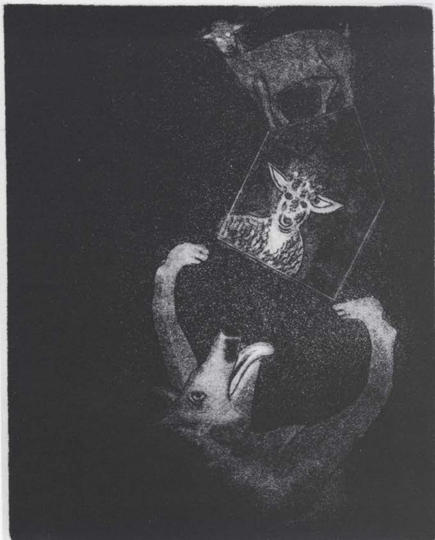
II/IV O lobo a cabra e o cabritinho Luis Cruz 95