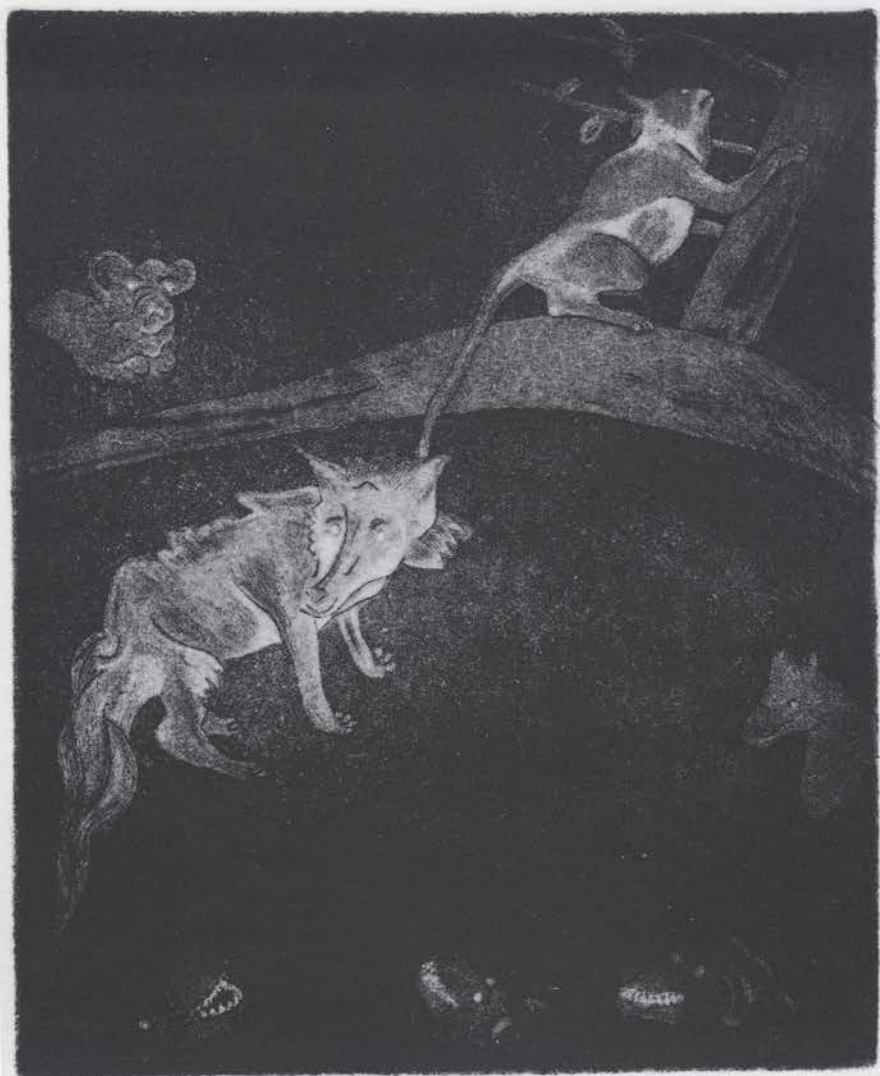
I/II O gato e a raposa