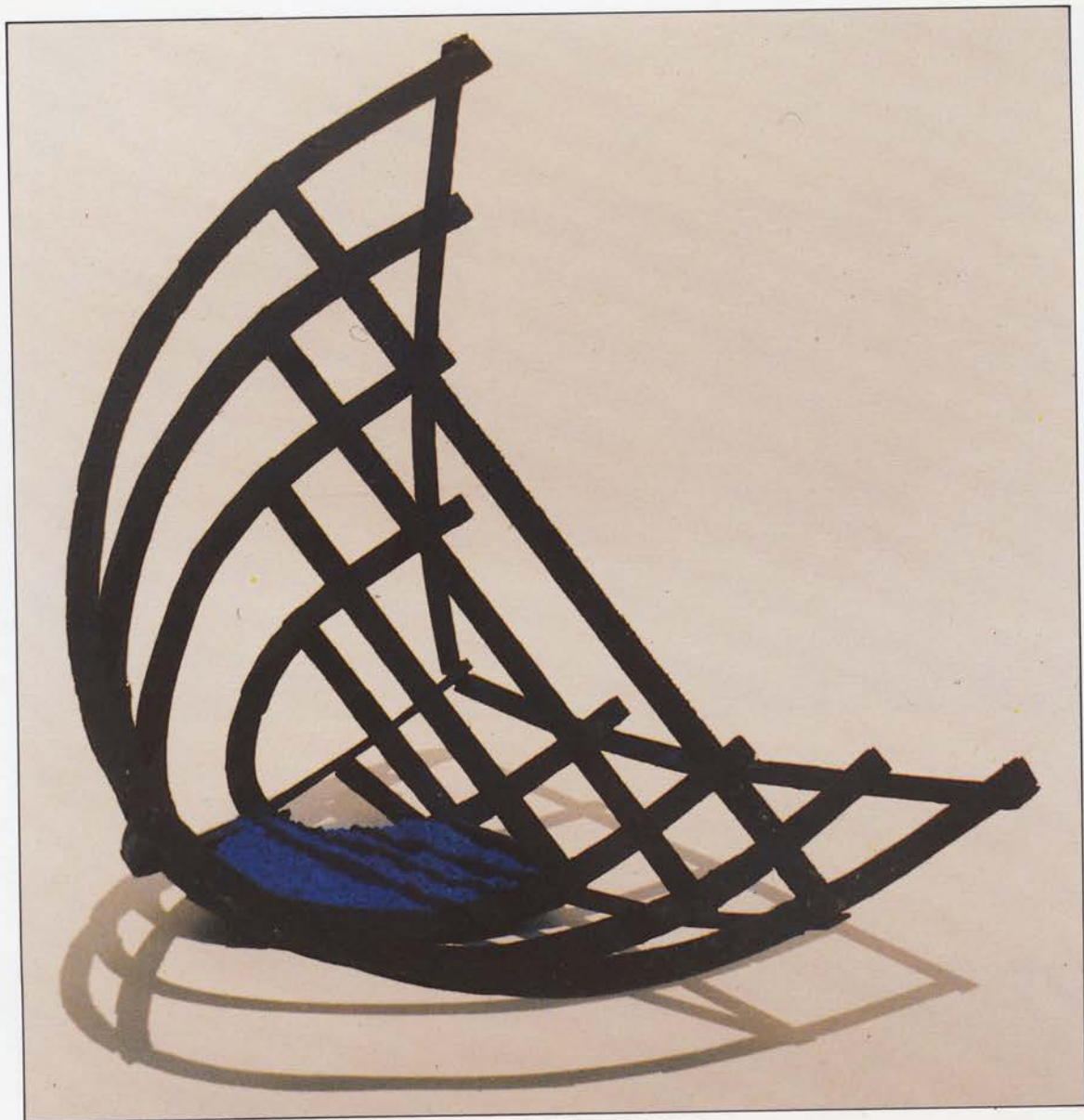
LUÍS CRUZ Triologia III, 1988 madeira 300 × 350 × 300 cm